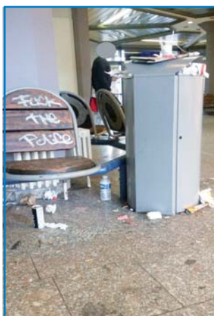
Gehören der Vergangenheit an: Überquellende Mülleimer am Bahnhof in Völklingen