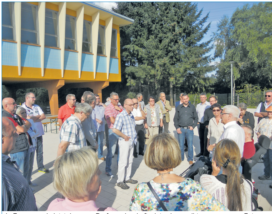
In Fenne wurde jetzt der neue Dorfgemeinschaftsplatz eingeweiht.

In einer reinen Bauzeit von rund drei Monaten wurde die 900 Quadratmeter große Fläche zwischen dem Spielplatz und dem Gebäude der Turnhalle von Grund auf saniert und neu aufgebaut. Dasselbe gilt für die Oberflächenentwässerung. Durch farblich unterschiedliche Pflasterbeläge werden die Bereiche Parkplatz und eigentlicher Platzbereich optisch kenntlich gemacht. Der neue Dorfgemeinschaftsplatz ist ausgestattet mit eigenem Strom- und Wasseranschluss. Zufahrt und Platzbereich werden durch LED-Mastleuchten auch bei Dunkelheit erhellt. Im bevorstehenden Herbst werden noch Anpflanzungen in den Grünstreifen entlang der seitlichen Grundstücksgrenzen vorgenommen sowie Bäume auf der Spielplatzseite ergänzt. Da es trotz mehrerer Versuche bisher nicht gelungen ist, dass der Stadtteil Fenne in ein Städtebauförderprogramm aufgenommen wird,