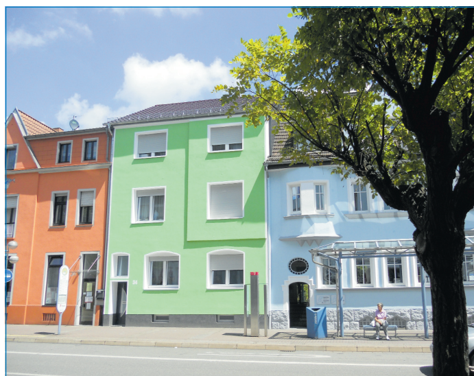
Auch ein Beispiel für gelungene Fassadensanierung: Häuser in der Bismarckstraße

Auskünfte: Stadt Völklingen: Herr Theis, Tel. 06898/13-2004, Email: wifo@voelklingen.de , Internet www.voelklingen.de .