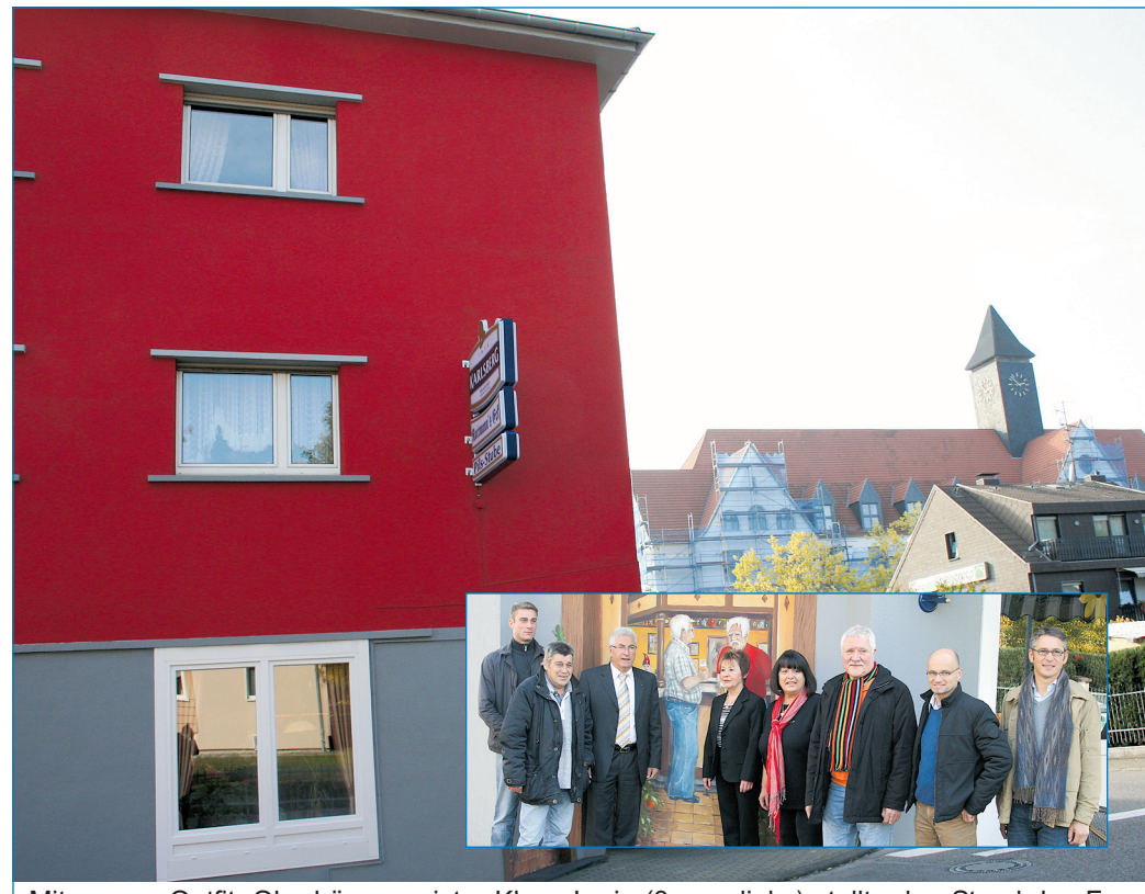
Mit neuem Outfit: Oberbürgermeister Klaus Lorig (3. von links) stellte den Stand des Fassadenprogrammes am Rottmann's Eck vor.

Das Fassadenprogramm steht unter dem Motto „Völklingen treibt's bunt“. Folglich sollen auch die sanierten Hausfassaden möglichst in leuchtenden Farben erstrahlen und für frisches Flair sorgen. „Die sanierten Gebäude setzen in der Innenstadt interessante Farbtupfer und lassen so den Stadtbau auch ohne große bauliche Eingriffe ins Auge springen“, stellt Oberbürgermeister Klaus Lorig zufrieden fest. Die beträchtliche Zahl der privaten Sanierungen gepaart mit den Investitionen der stadtteiligen Stadtentwicklungsgesellschaft und der Wohnungsbaugesellschaft GSW machen deutlich, dass Eigentümer und Investoren an eine positive Entwicklung der City glauben. „Es zählt sich nun