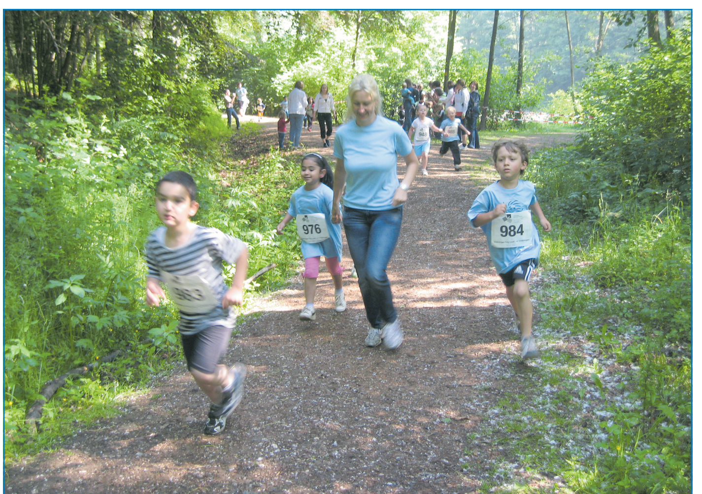
Eltern und Kinder hatten viel Spaß bei den Kindergarten-Waldlaufmeisterschaften

führt in Schulen und Kindergärten flächendeckend Gruppenkurse zur Zahnprophylaxe durch. Sie hat den „Pro-