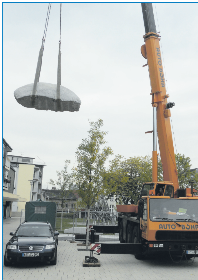
Schwebendes Ungetüm: Vier Tonnen Granit sind in der Luft

dem Kornmarkt im rheinland-pfälzischen Trier hat er bereits ein Bodenwasserrelief installiert und dafür viel Beifall erhalten. Auch für Völklingen ist er sich sicher, dass sein Kunstwerk in dieses Umfeld passt. Vor allem aber wünscht er sich, dass es von möglichst vielen großen oder kleinen Besuchern auch genutzt wird. Denn die Arbeit soll sich auf diese Weise lohnen.