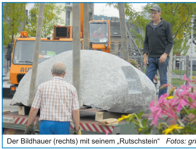
Der Bildhauer (rechts) mit seinem „Rutschstein“