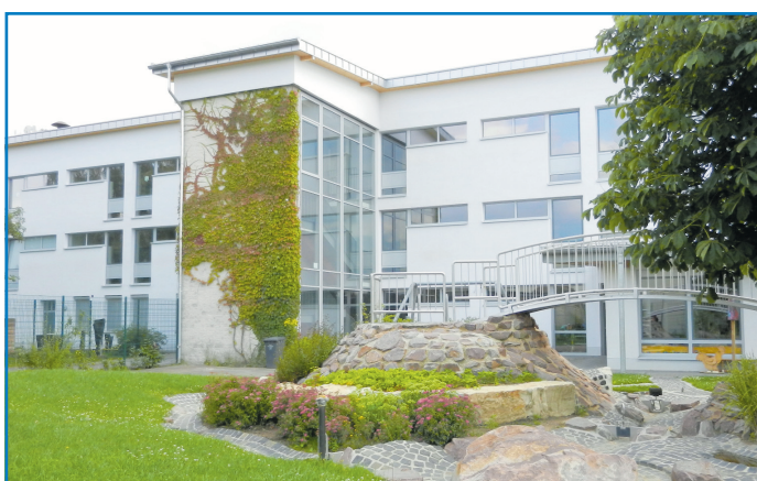
Grundschule Lauterbach: Sanierung in der Ferienzeit

Veranstalter: Stadt Völklingen, Kulturgut e.V.