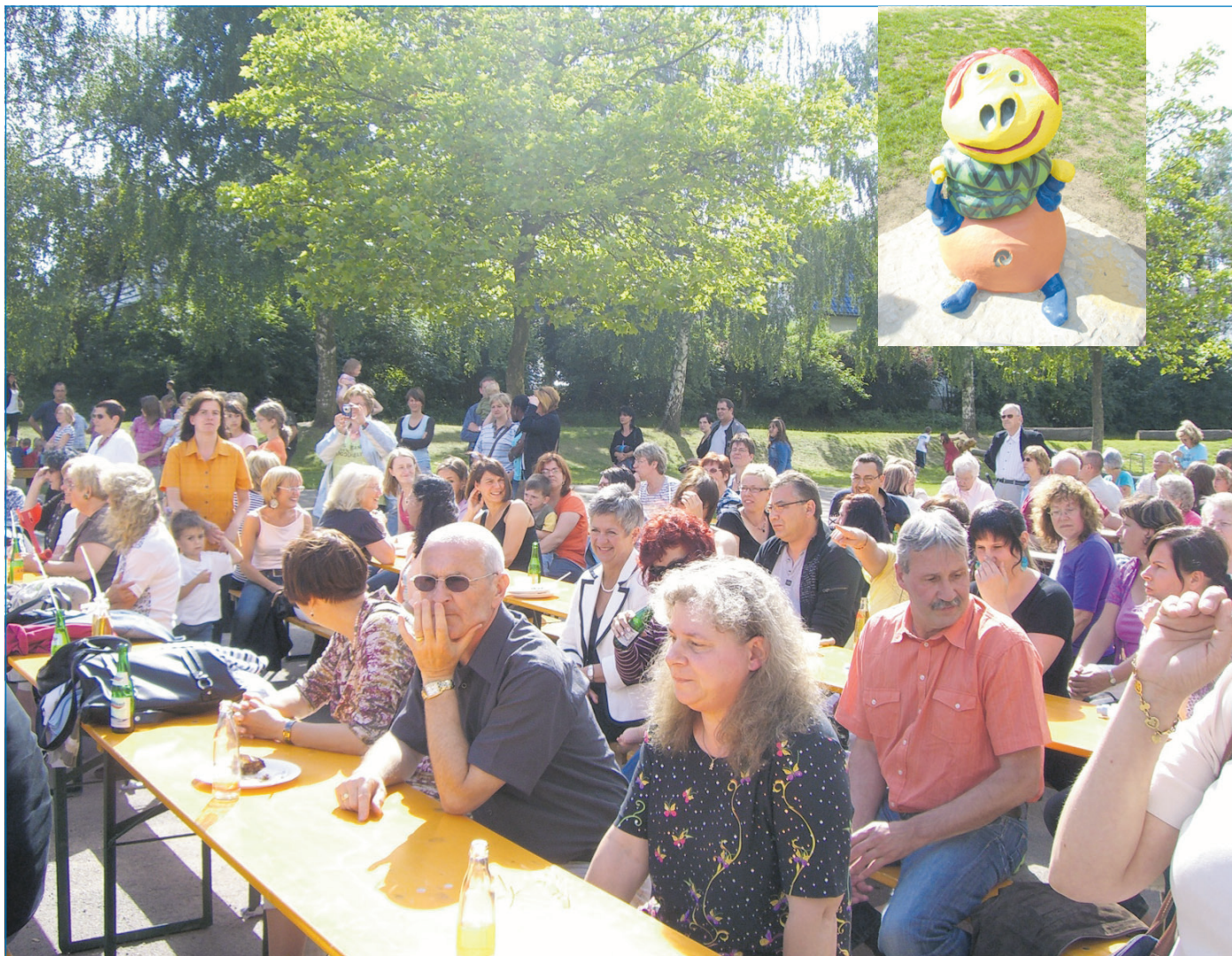
Großer Andrang herrschte bei der Einweihung des Spielplatzes an der Schule Lauterbach

als vorbildlich“ sei. Sein Dank ging an Schule, Schulleitung, Förderverein, den Lions Club Völklingen sowie alle Beteiligten wegen der guten Zusammenarbeit. Die Planung und Ausführung des Spielplatzes, der rund 1000 Quadratmeter groß ist, lag in der Hand der Stadt Völklingen 60.000 Euro kostete der Spielplatz. ●