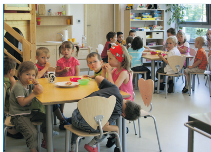
Auch das Angebot der Völklinger Kindertageseinrichtungen wird beim Familientag vorgestellt

Bürgerinnen und Bürgern zur Verfügung. Darüber hinaus werden am Bühnenprogramm des Saarländischen Familientages, der in diesem Jahr zum zweiten Mal veranstaltet wird, die Musical-AG der Grundschule Haydnstraße sowie die Tanzgruppen des JUZ-Völklingen teilnehmen. Das Bühnenprogramm findet im Erlebnisbereich „Helfen, Engagement, Lebenswelten“ statt, der im Bereich der City-Promenade und des Pfarrgartens eingerichtet wird. Die Stadt Völklingen ist neben der Landesregierung und dem Weltkulturerbe Völklinger Hütte Mitveranstalter des Saarländischen Familientages 2009. Das Motto lautet „Saarland – Wir leben Familie“.